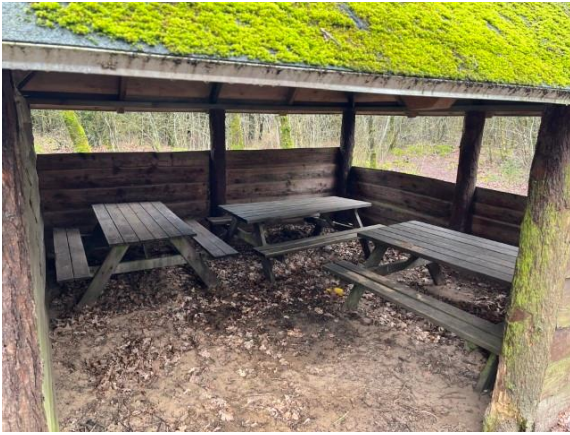
Foto 6 - redskabsskur