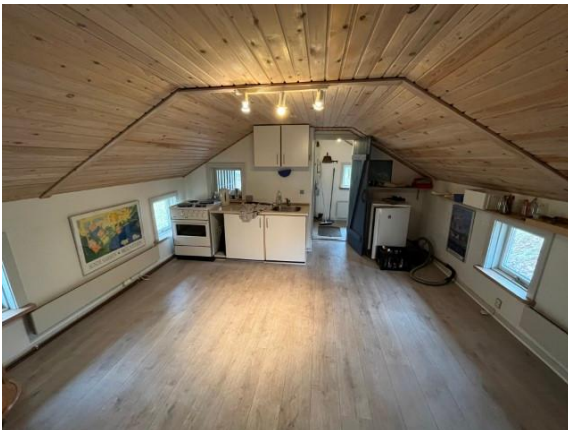
Foto 2 - entré