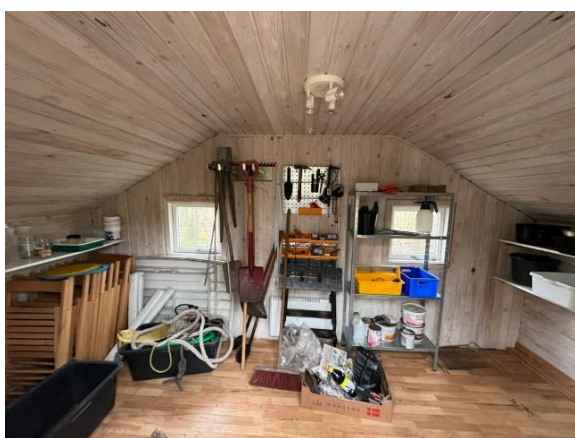
Foto 5 - åben opholdshytte